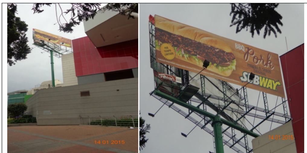
NOMENCLATURA Y VISTA PANORAMICA DEL INMUEBLE DONDE SE ENCUENTRA INSTALADO EL ELEMENTO TIPO VALLA COMERCIAL TUBULAR – SUR-NORTE